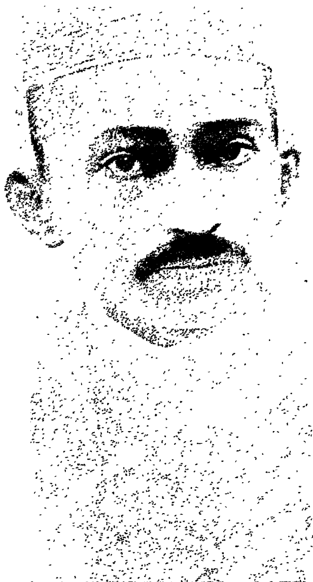
काश्मीरी टोपी पहने हुए